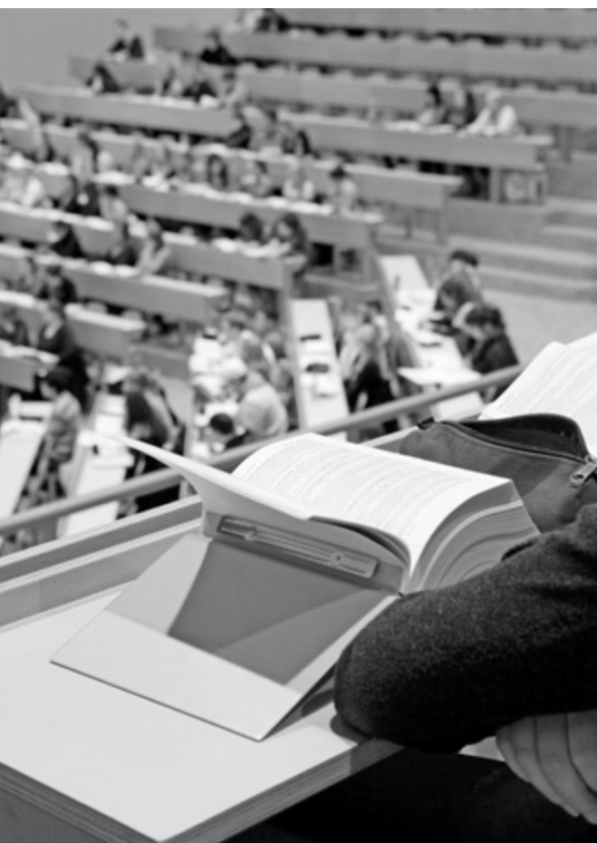
Vorlesung im Audimax