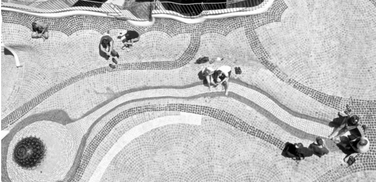
Universität Konstanz