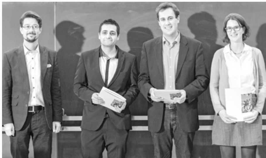
Lehrpreis für Nachwuchs- wissenschaftler*innen, (Foto: Jespah Holthoff)