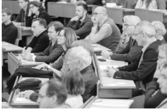
20 Jahre Wirtschaftspädagogik an der Universität Konstanz