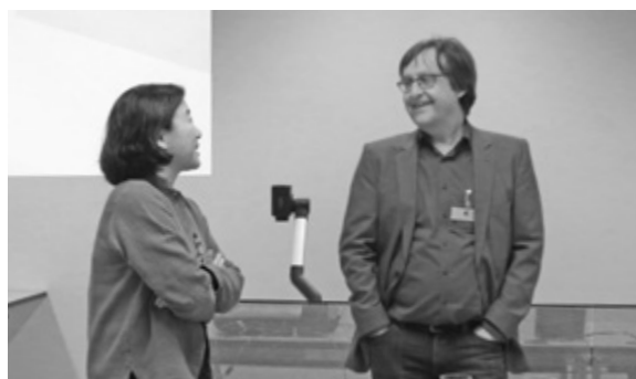
Thurgau Experimental Economics Meeting (theem) zum 10. Jubiläum