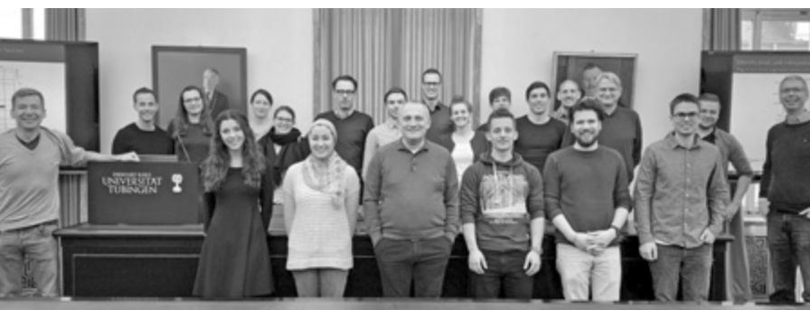
Doctoral Workshop in Econometrics